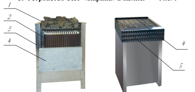
3. Устройство ЭНУ «Карина» в камне. Рис. 1

Расстояние от электронагревателя до стен и деревянных ограждений не менее 15 см, до потолка не менее 1,2 м. При установке ЭНУ с меньшими расстояниями на деревянные стены и потолок необходимо установить защитный экран из нержавеющей стали.